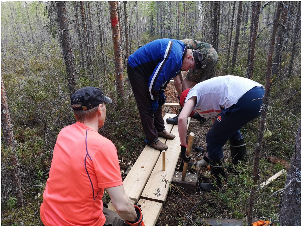
Kylmäreameen pitkospuut uudistettiin toukokuussa 2020.

PITKOSPUITA toteutettiin luontopolun kahdella osuudella. Kylmäreameellä uudistettiin vanhat pitkospuut ja lisäksi luontopolun ensimmäisen sillan ja kota-alueen väliseen kosteaan kohtaan tehtiin uudet pitkospuut.